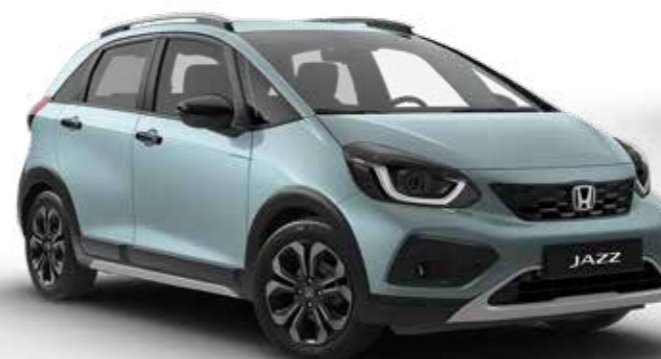
Fjord Mist Pearl