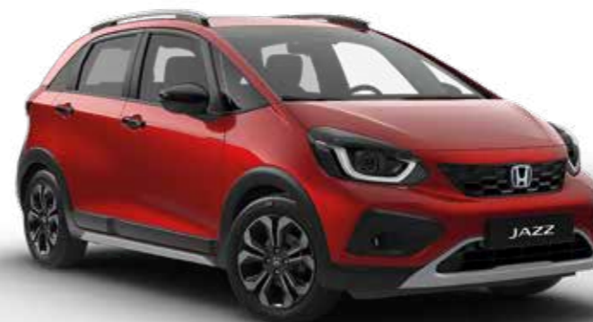
Premium Crystal Red Metallic

Δημιουργήσαμε μια ευρεία σειρά από χρώματα που ταιριάζουν απόλυτα με το στυλ του νέου Jazz Crosstar. Συμπληρώνονται από μια επιλογή εσωτερικών επενδύσεων υψηλής ποιότητας.