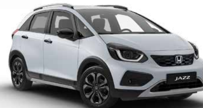
Premium Sunlight White Pearl