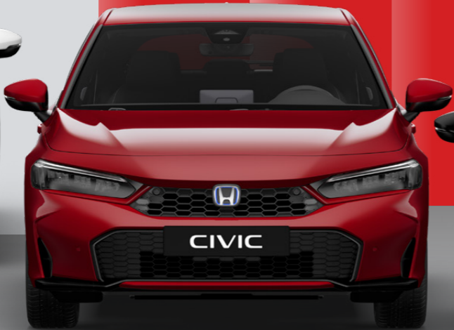
Premium Crystal Red Metallic