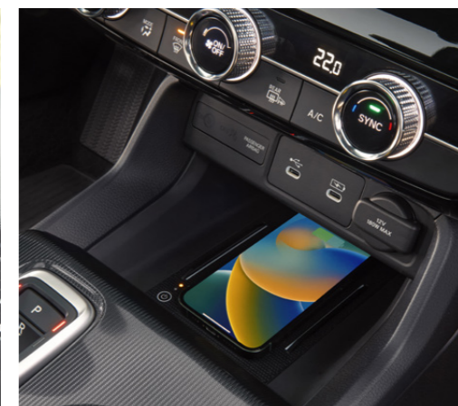
△ ΑΣΥΡΜΑΤΗ ΦΟΡΤΙΣΗ