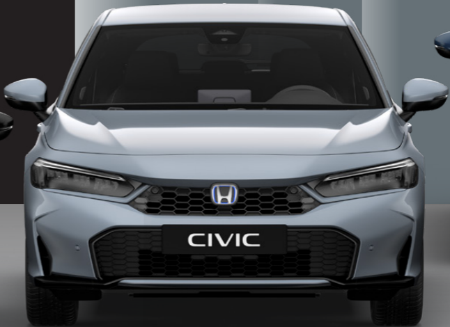
Sonic Grey Pearl