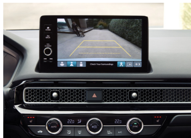
△ ΚΑΜΕΡΑ ΣΤΑΘΜΕΥΣΗΣ