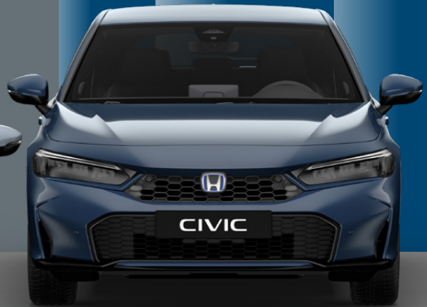
Seabed Blue Pearl

Το μοντέλο που εμφανίζεται είναι η έκδοση Elegance.